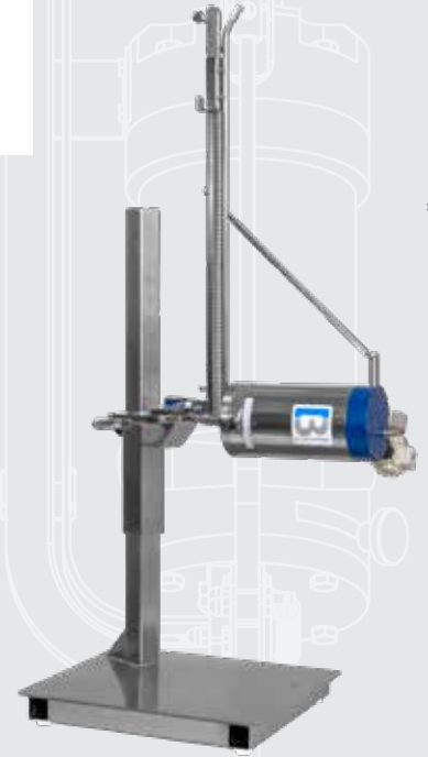
AUCH IN HORIZONTALER VERSION VERFÜGBAR